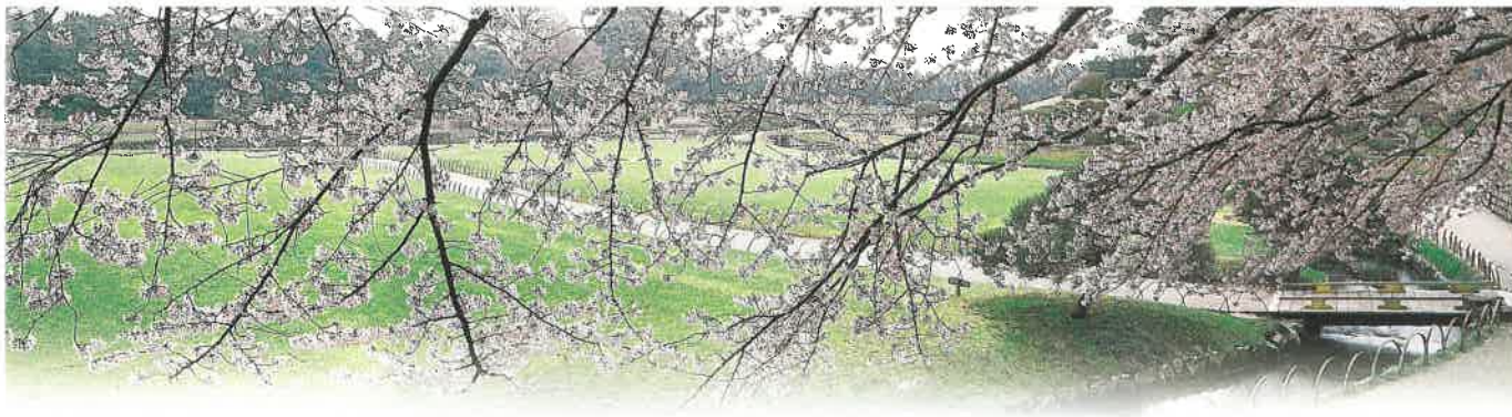
Vue du jardin de la porte du sud