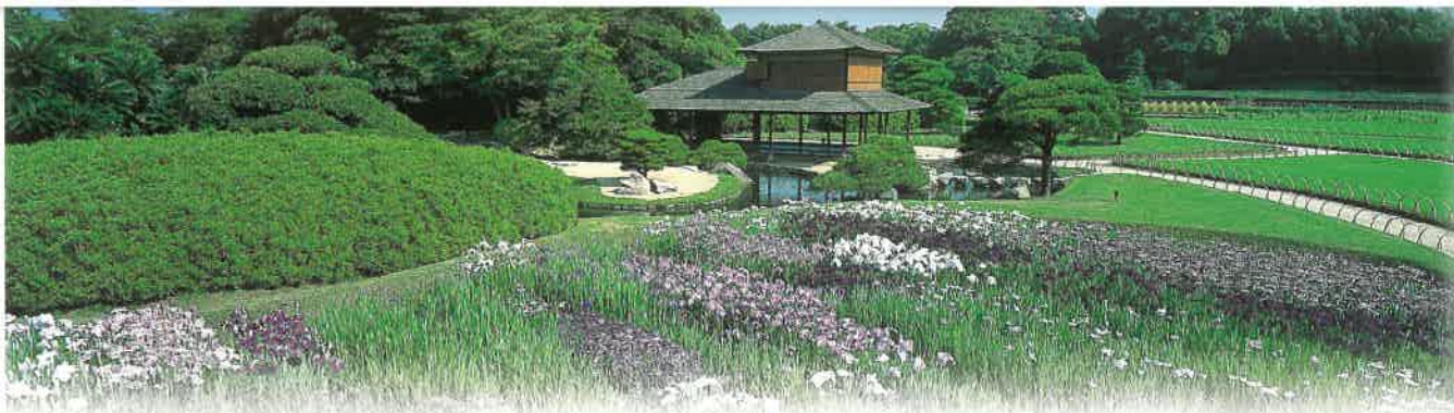
Ryū-ten et iris