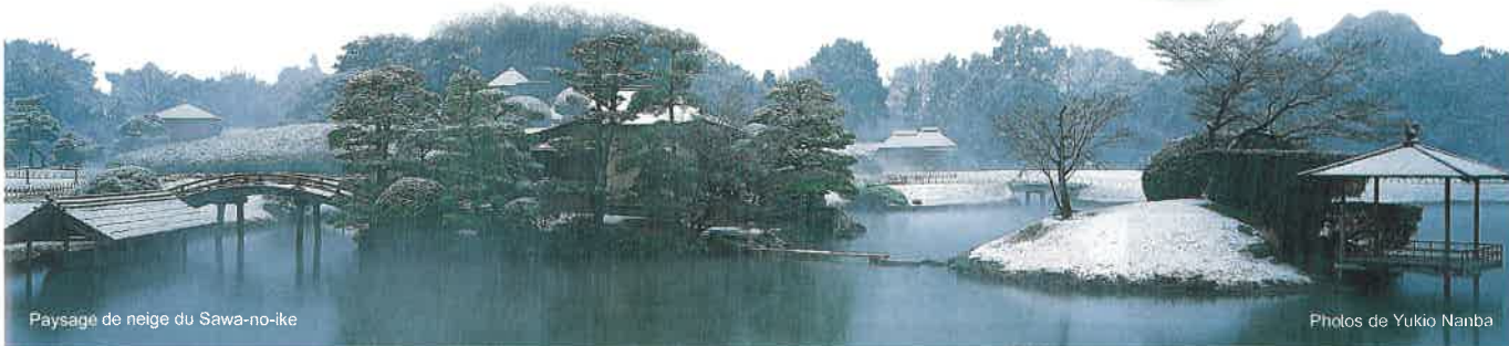
Paysage de neige du Sawa-no-ike