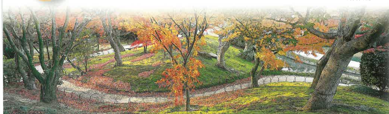
Érables du Yuishin-zan