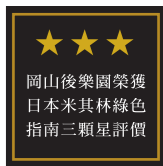
岡山後樂園榮獲日本米其林綠色指南三顆星評價

貞享4年(1687)，家臣津田永忠奉岡山藩主池田綱政公之命，開始動工建造後樂園，於元祿13年(1700)建成。之後，藩主雖然按自己的興趣作了一些增改，但是，我們現在所見到的後樂園基本上還是保持著江戶時代的風貌，幾乎沒有大的改變。 另外，至今還保留著很多江戶時代的繪畫、池田家的記錄、文物，可以作為了解歷史的變遷之鑒，後樂園是一座地方上很少見的諸侯庭園。 後樂園除了藩主用於靜心養身和接待賓客之處外，有時規定日期，允許平民百姓來園參觀。 明治17年(1884)後樂園歸屬岡山縣管理，並正式對外開放。 雖然在昭和9年(1934)的大水災和昭和20年(1945)的戰禍下，屢遭毀壞。後以江戶時代的圖紙為依據，重新進行了修建。 昭和27年(1952)根據文化遺產保護法，被指定為「特別名勝」之地，我們將努力保護和管理這座作為向後代傳述歷史的文化遺產。