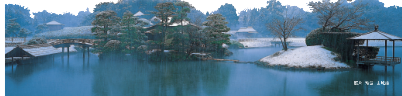
照片 滩波 由城雄