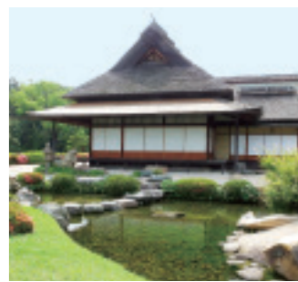
该园建造在冈山城后故被称为后园。明治4年(1871), 基于其“先忧后乐”之精神, 改名为后乐园。