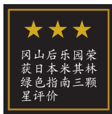
冈山后乐园荣获日本米其林绿色指南三颗星评价

昭和27年(1952)根据文化遗产保护法, 被指定为“特别名胜”之地, 我们将努力保护和管理这座作为向后代传述历史的文化遗产。