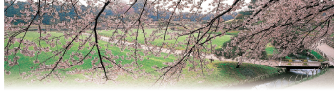
Vue du jardin de la porte du sud

Le Kōrakuen d'Okayama est un des jardins les plus représentatifs réalisés par les daimyō de l'époque d'Edo. La passion des daimyō successifs se manifeste dans des bâtiments tels que l'Enyō-tei ou le théâtre de nō , ainsi que dans les maisons de thé et les petites chapelles disposées ici et là. Le Kōrakuen est dessiné dans le style du Kaiyū (jardin à promenade), où les voies fluviales et terrestres relient les vastes pelouses, les étangs, les collines et les pavillons de thé. En flânant, on peut découvrir une nouvelle vue de tout côté.