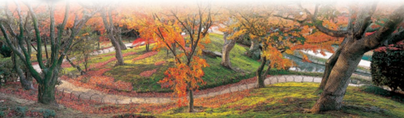
Érables du Yuishin-zan