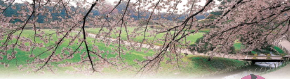
南門側から園内を望む