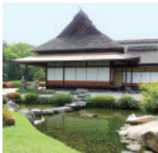
名称は、岡山城の後ろに作られた園という意味で後園と呼ばれていましたが、「先憂後楽」の精神に基づいて造られたと考えられることから、明治4年(1871)後楽園と改められました。