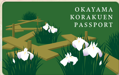
八橋とカキツバタ