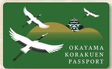
タンチョウと岡山城