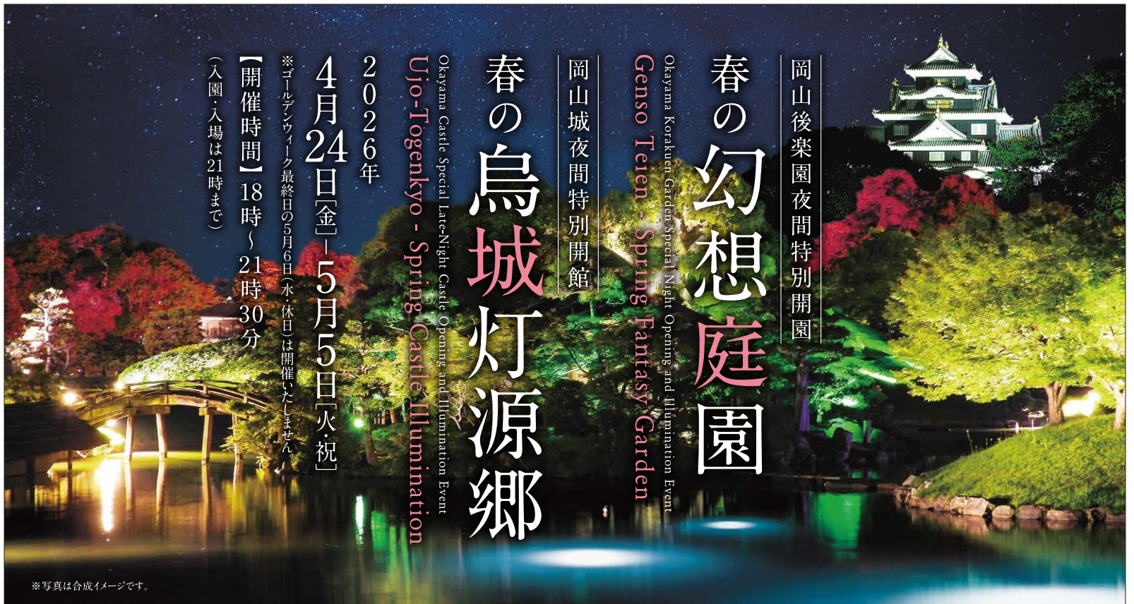
※写真は合成イメージです。